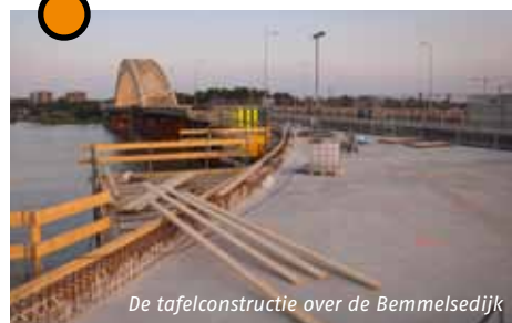
De tafelconstructie over de Bemmelsedijk

Ten oosten van de tijdelijke verkeersdijk bouwen we aan de bovengrondse L-wand van de waterkering.