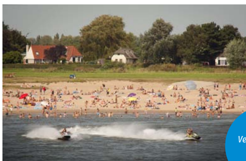
Vermaak aan de Waal