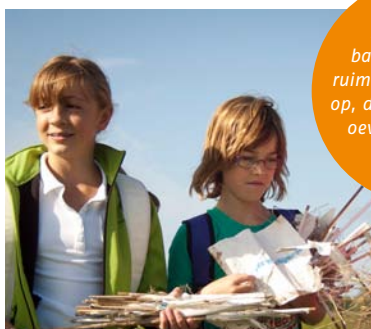
Kinderen van basisschool Talent ruimden de vlaggetjes op, die de toekomstige oevers van de geul markeerden.