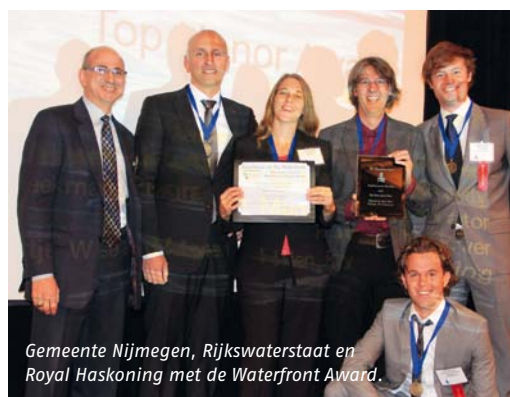
Gemeente Nijmegen, Rijkswaterstaat en Royal Haskoning met de Waterfront Award.

De campagne Lentereiland kreeg in Berlijn een Red Dot, de belangrijkste Europese designonderscheiding. Lentereiland laat zien hoe Lent verandert als gevolg van de dijkverlegging. Vorig jaar verscheen de Lenterbox (met twee boeken en een kaart) en werden er opvallende rode Lentmarks (informatiepunten) in het plangebied geplaatst. Lentereiland is in opdracht van de gemeente Nijmegen bedacht en uitgevoerd door bureau Dieben&partners/2d3d. De Lenterbox is in de boekhandel verkrijgbaar.