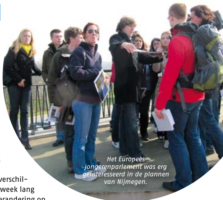
Het Europees jongerenparlement was erg geïnteresseerd in de plannen van Nijmegen.

Op www.facebook.com/Waterparlement kunt u het verslag van de jongeren lezen.